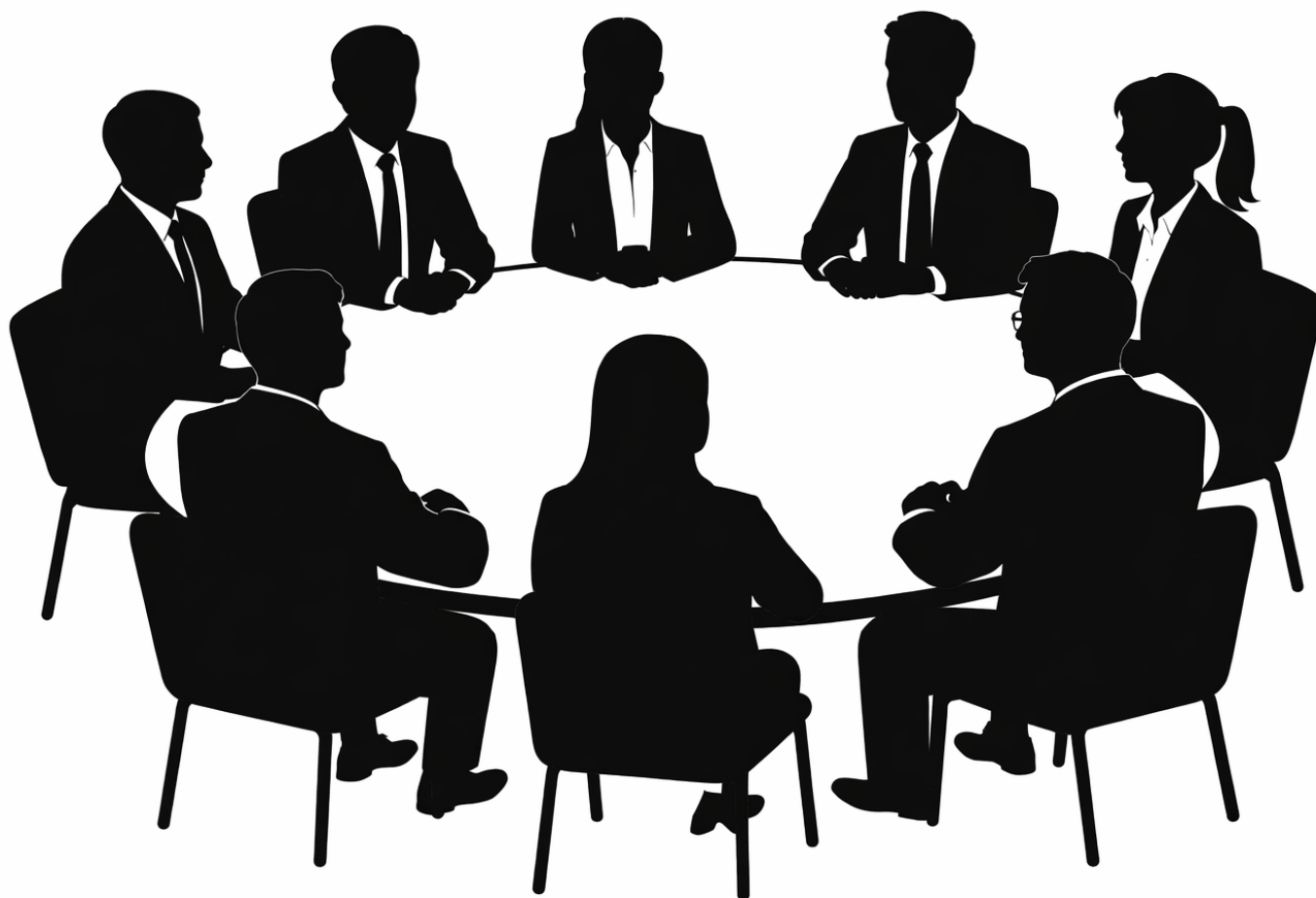
Quadro 1. Constituição da Comissão de Cogestão do PNLN (aos 31.12.2025).