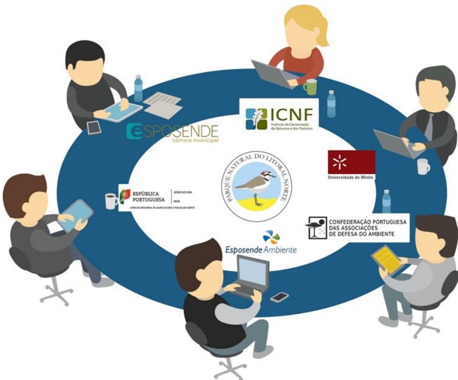
Quadro 2. Constituição da Comissão de Cogestão do PNLN.